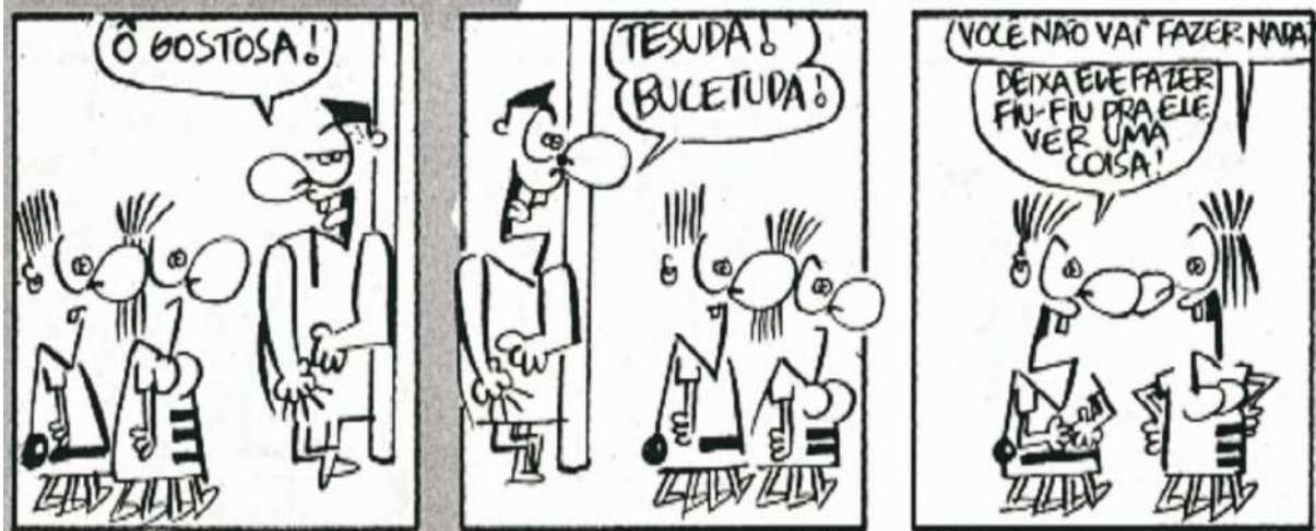
Figura 04 – Casal Neura

desestabilização da beleza, o que pode demonstrar mau gosto. Dessa forma, “as manifestações do grotesco nos mais variados contextos recebem a designação de mau gosto, o que pode ser visto como um sintoma do papel subversivo dessa categoria estética” (Santos, 2009, p. 262). A Figura 04 mostra o Casal Neura, de Glauco, em uma situação muito embaraçosa.