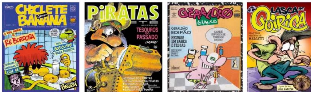
Figura 01 – Capas de Chiclete com Banana , Piratas do Tietê , Geraldão e Lasca de Quirica