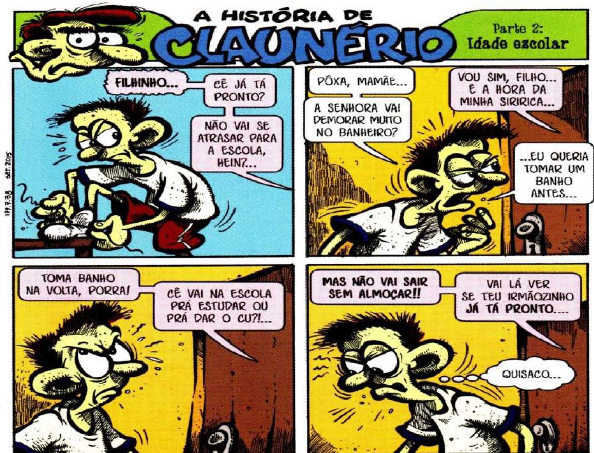
Figura 05 – A história de Claunério

Fonte: Lasca de Quirica n. 03 (Marcatti, 2015, p. 24).