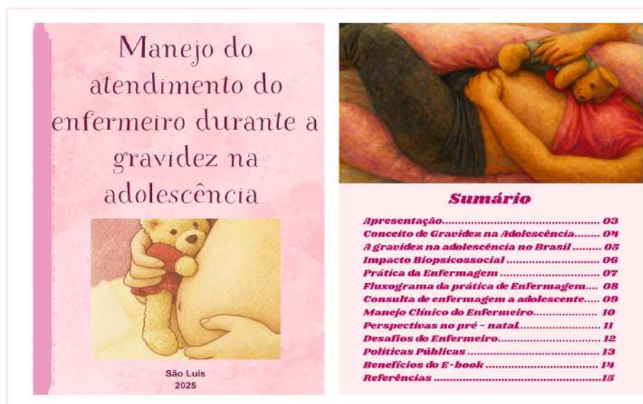
Figura 1. Representação ilustrativa de capa e sumário do E-book sobre o “Manejo do atendimento do enfermeiro na gravidez na adolescência”

Seguindo o percurso metodológico deste trabalho, temos a produção de um E-book apresentado a seguir, formulado através de informações sobre o atendimento do enfermeiro na gravidez na adolescência da revisão integrativa anteriormente apresentada.