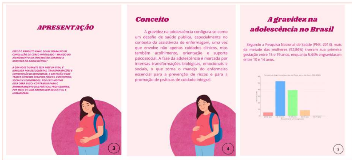
Figura 02. Representação ilustrativa de sequência de páginas iniciais do E-book sobre o “Manejo do atendimento do enfermeiro na gravidez na adolescência”

Na figura 03 é possível expor a próxima sequência de páginas do E-book caracterizadas por representar o “Impacto Biopsicossocial”, “As práticas de enfermagem”, “Fluxograma de atendimento” e a “Consulta de enfermagem” a partir do seu “Manejo clínico” e “Perspectivas do pré-natal”. Essas etapas abordaram os riscos obstétricos e as consequências sociais, como a evasão escolar.